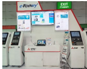
稼動監視展示コーナー