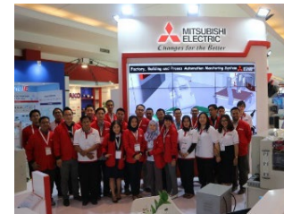
出展ブース (インドネシア)

今後も更なる伸長が期待されるインドネシア市場において三菱CNCを安心してお使いいただけるように、サービスサポートを更に強化してまいります。