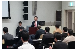
三菱CNC新機能紹介セミナー

M800/M80/C80シリーズの新機能紹介や工作機械向けIoTソリューションの紹介を行い、お客様から高い関心をいただきました。また、三菱CNCグローバルサービス事業の紹介とMMEG修理棟などのご視察により、「いつでも どこでも いつまでも」をスローガンとした当社サービス理念と充実したサービス体制に対して高い評価をいただきました。