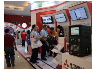
三菱CNC展示コーナー